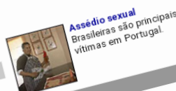
Assédio sexual: Brasileiras são principais vítimas em Portugal.