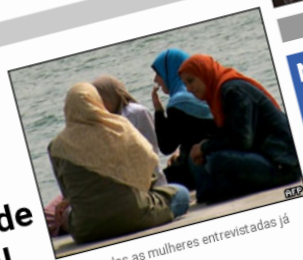
Quase todas as mulheres entrevistadas já sofreram assédio

Cerca de um terço das mulheres no Egito é vítima de assédio sexual diariamente, indicam os resultados preliminares de uma pesquisa do Centro Egípcio de Mulher.